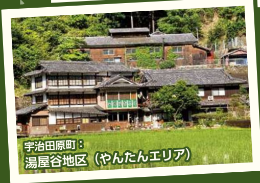
宇治田原町: 湯屋谷地区 (やんたんエリア)