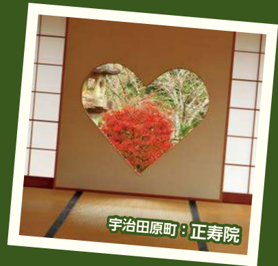
宇治田原町:正寿院