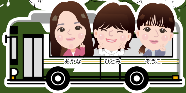
あやな ひどみ そうこ