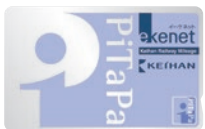
京阪マイレージPiTaPaカード